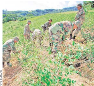
LA REGIÓN DE LOS YUNGAS SE CONVIRTIÓ AYER EN ESCENARIO DE CONFLICTO ENTRE COCALEROS Y MILITARES.