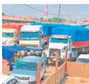
ESPERAN RECAUDAR MÁS DE 10 MILLONES DE DÓLARES CON LA NACIONALIZACIÓN DE LAS "CHATAS".