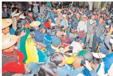
ESTA RESERVA NATURAL ESTÁ PROTEGIDA POR LA LEY CORTA QUE HA SIDO PROMULGADA POR EL PRESIDENTE EVO MORALES.

La seguridad jurídica en el país se ve afectada con la pretensión manifiesta desde el oficialismo para modificar la Ley 180 de defensa del Territorio Indígena del Parque Nacional, Isiboro Sécuré (TIPNIS) y esto repercutirá en un proceso de ingobernabilidad, según explicaron analistas políticos.