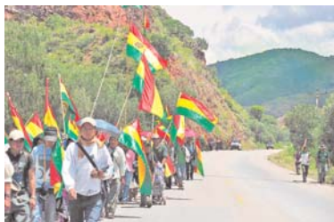
MARCHISTAS DEL CONSEJO DE INDÍGENAS DEL SUR (CONISUR) SE APROXIMAN A LA CIUDAD SEDE DE GOBIERNO, EXIGIENDO LA CONSTRUCCIÓN DE CARRETERA POR EL TIPNIS, PESE A QUE

• Interpretaciones del Gobierno sobre normas provocan inestabilidad en el país, según el politólogo Carlos Cordero.