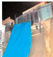
LUGAR DEL DESLIZAMIENTO EN LA CALLE FERMIN PRUDENCIO.