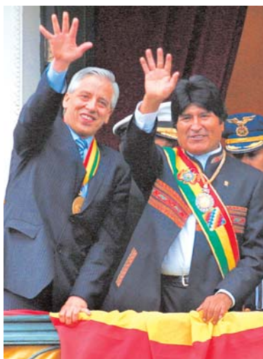
EL PRESIDENTE EVO MORALES Y EL VICEPRESIDENTE ALVARO GARCÍA PARTICIPAN DE LA CELEBRACIÓN DEL SEGUNDO ANIVERSARIO DE CREACIÓN DEL ESTADO PLURINACIONAL DE BOLIVIA.