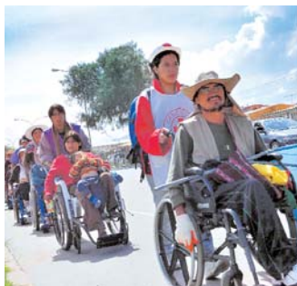
LA CARAVANA DE LA INTEGRACIÓN SE ENCUENTRA EN QUILLACOLLO.

El ministro de la Presidencia, Carlos Romero, dijo en conferencia de prensa en Palacio Quemado, que el acuerdo firmado establece la conformación de una comisión integrada por el Ministerio de Justicia, Salud y la Presidencia, además de los representantes de las organizaciones de personas con capacidades diferentes y de la caravana para realizar un estudio técnico-financiero de la viabilidad del pago de una asistencia económica.