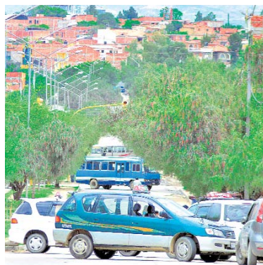
LAS MEDIDAS DE PRESIÓN EN TARIJA SE MANTIENEN.

El presidente cívico denunció, en pasadas semanas, que hay un claro favoritismo del gobierno con el vecino departamento de Chuquisaca.