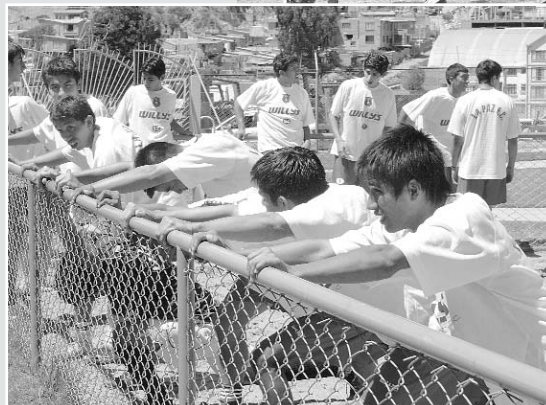
ARRIBA, JUGADORES DE THE STRONGEST, LUEGO DE EMPATAR EN IQUIQUE CONTRA EL DEPORTIVO DE ESA CIUDAD 0-0. ESTA SEMANA CONTINUARÁN CON SUS PRÁCTICAS. ABAJO, FUTBOLISTAS DE LA PAZ FÚTBOL CLUB QUE DE A POCO TOMA CUERPO CON LAS NUEVAS CONTRATACIONES. AMBOS CLUBS ENTRENAN SIN PAUSA PARA EL INICIO DEL TORNEO "LIGUERO".