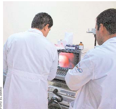
LOS MÉDICOS SE DECLARARON EN EMERGENCIA POR LA AMPLIACIÓN DE LA JORNADA LABORAL A OCHO HORAS.

Por otro lado, el ministro de Hidrocarburos y Energía,