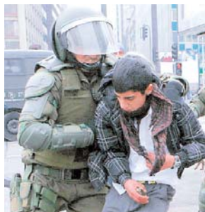
POLICÍA REPRIME MANIFESTACIONES EN CHILE.

Los Reporteros Sin Fronteras (RSF) identificaron a Chile, en su clasificación anual, como el país en el que la libertad de prensa sufre el mayor deterioro, mientras que Cuba y México volvieron a ocupar las peores posiciones del continente.