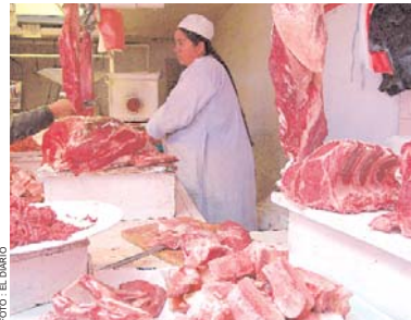
PRODUCTORES ADVIERTEN SOBRE LOS EFECTOS QUE TENDRÁ LA EXPORTACIÓN DE CARNE A MERCADOS INTERNACIONALES.