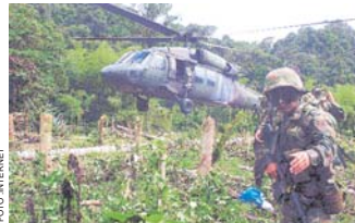
OPERATIVO MILITAR ACABA CON MÁS DE TRES DECENAS DE GUERRILLEROS EN COLOMBIA.

La ofensiva contra una columna del grupo irregular se registró cerca del municipio de Arauquía, en el departamento del Arauca, en el noreste del país, en la misma región en donde el último sábado esa guerrilla asesinó a 11 militares.