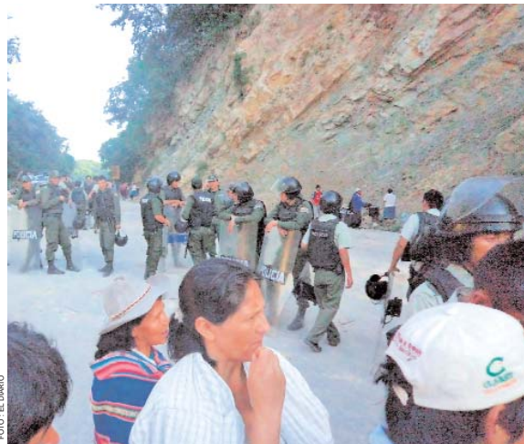
EL BLOQUEO EN BERMEJO PERJUDICA EL COMERCIO EN LA FRONTERA, MIENTRAS LOS CAÑEROS EN LA PAZ CONTINUARON PROTESTANDO EN LA AVENIDA MARISCAL SANTA CRUZ.

• Inf. Pág. 4, 3er. Cuerpo • Inf. Pág. 6, 4to. Cuerpo