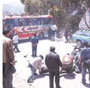
EL ALTO RECHAZÓ CON PARO CONTUNDENTE EL INCREMENTO DE LAS TARIFAS DE TRANSPORTE.