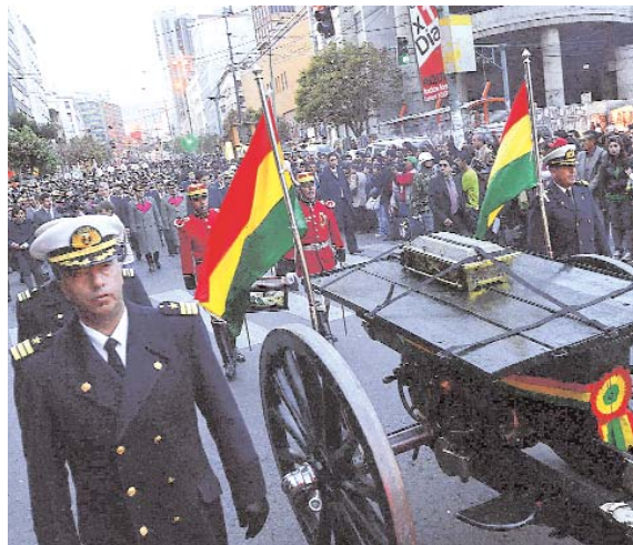
EL TRASLADO DE LA URNA QUE CONSERVA LOS RESTOS DE DON EDUARDO AVAROA, MARCÓ EL INICIO DEL DÍA DEL MAR, UNA JORNADA CÍVICA QUE UNE A LOS BOLIVIANOS Y QUE ELIMINA DIFERENCIAS POLÍTICAS Y REGIONALES.