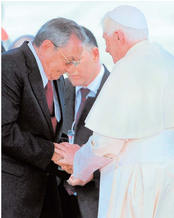
RAÚL CASTRO, EN GESTO REVERENCIAL, RECIBE AL PAPA A SU LLEGADA A TIERRA CUBANA. LA ISLA VIVE UN MOMENTO ESPECIAL CON LA PRESENCIA DEL SUCESOR DE PEDRO.