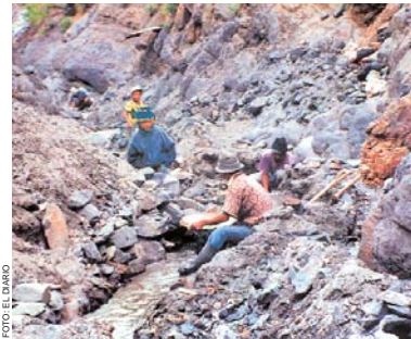
EL CENTRO MINERO AMAYAMPAMPA, UBICADO EN POTOSÍ, ES EL YACIMIENTO MÁS RICO EN ORO.