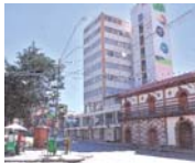
SISMO OCASIONÓ RAJADURAS EN ALGUNOS EDIFICIOS ANTIGUOS DE LA CIUDAD DE ORURO.