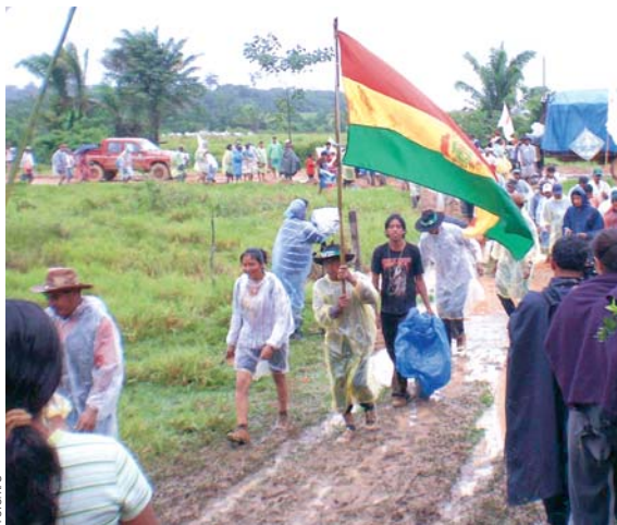
LA NOVENA MARCHA INDÍGENA, CON 400 INTEGRANTES, ESTÁ PRÓXIMA A LA FRONTERA ENTRE BENI Y LA PAZ, PASARON EL ESCOLLO DE YUCUMO, EL BARRO Y EL MAL TIEMPO.