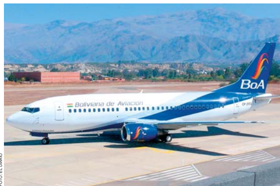
UNA DE LAS NAVES DE BOA QUE MARCHA AL FRENTE EN EL MERCADO AÉREO Y AHORA QUE AEROSUR ENTRÓ EN RECESO TAMBIÉN COPARÁ EL MERCADO DE CARGA.

tualmente no hay condiciones de competencia, puesto que las empresas aéreas