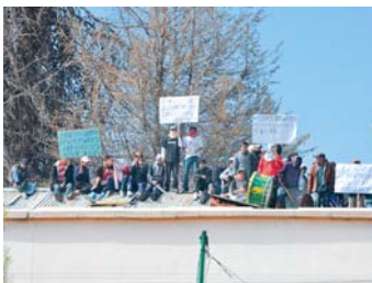
INTERNOS DE LA CÁRCEL DE SAN PEDRO PROTESTAN POR LA RETARDACIÓN DE JUSTICIA.

Los representantes de 1.200 detenidos denunciaron ayer que un 84 por ciento de la población penal de San Pedro no tiene sentencia y precisaron que de 100 audiencias de medidas cautelares sólo se realizan cuatro.