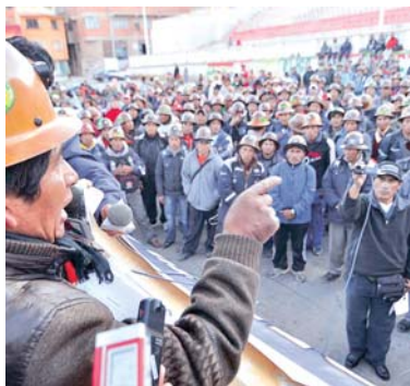
LOS MINEROS COOPERATIVIZADOS RECHAZAN LA DETERMINACIÓN DE ESTADIZAR COLQUIRI POR LO QUE INICIARON ACCIONES DE PROTESTA EN OROURO.