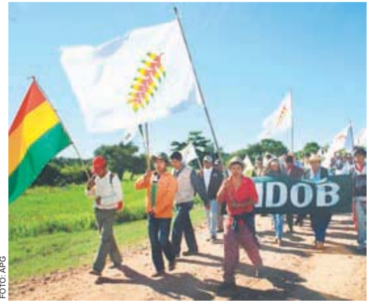
LA IX MARCHA QUE SE DIRIGE A LA CIUDAD DE LA PAZ RECHAZA LA LEY 222 DE CONSULTA PREVIA Y PIDEN RESPETO A LA NORMA QUE PROTEGE EL TIPNIS.