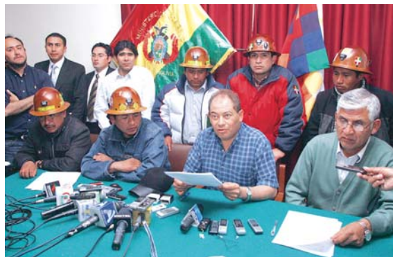
UN ACUERDO DEL GOBIERNO CON LOS MINEROS COOPERATIVISTAS Y ASALARIADO PUSO FIN A LAS JORNADAS DE BLOQUEO Y VIOLENCIA EN COLQUIRI.