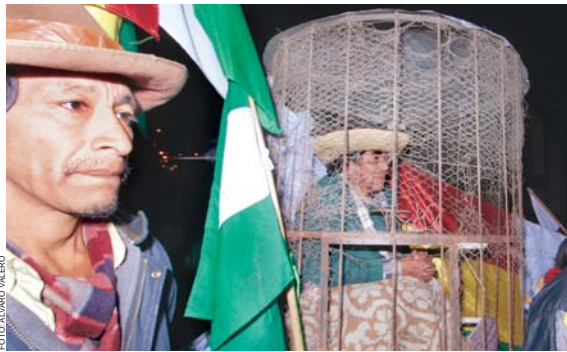
LOS INDÍGENAS DE LA NOVENA MARCHA MANTIENEN VIGILIA Y BLOQUEAN EL ACCESO A LA VICEPRESIDENCIA DEL ESTADO, MIENTRAS EL GOBIERNO AÚN NO DA RESPUESTA AL PEDIDO DE DIÁLOGO.