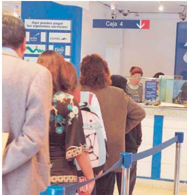
CRÉDITOS Y DEPÓSITOS DEL SISTEMA BANCARIO NACIONAL SUPREN DESCENSO.