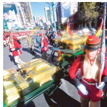
LOS EFECTIVOS DEL REGIMIENTO BATALLÓN COLORADOS TRASLADAN LAS URNAS DEL PEDRO DOMINGO MURILLO Y OTROS PROTOMÁRTIRES.