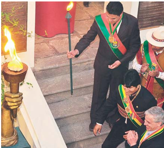
EL ALCALDE REVILLA, EL GOBERNADOR CÓCARICO, EL PRESIDENTE MORALES Y EL VICEPRESIDENTE GARCÍA EN EL ENCENDIDO DE LA TEA EN ACTO CUMPLIDO AYER EN LA CASA DE PEDRO DOMINGO MURILLO.

• El paceño que vive estresado por las ruidosas protestas de diferentes sectores espera obras de gran magnitud en su condición de Ciudad Sede de Gobierno.