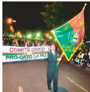
EL DESFILE DE TEAS CUMPLIDO ANOCHÉ, GRUPO A INSTITUCIONES CÍVICAS, PÚBLICAS Y ESTABLECIMIENTOS EDUCATIVOS.