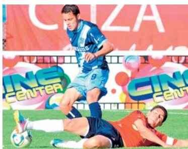
WILSTERMAN NO PUDO HACER PREVALECER SU CONDICIÓN DE LOCAL Y BOLÍVAR FESTEJO CON VICTORIA EL ANIVERSARIO DE LA PAZ.

En la Villa Imperial, Real Potosí ganó la Copa Invierno del Sur tras vencer por 1 a 0 a Nacional Potosí en la última fecha que se jugó en el estadio Víctor Agustín Ugarte.