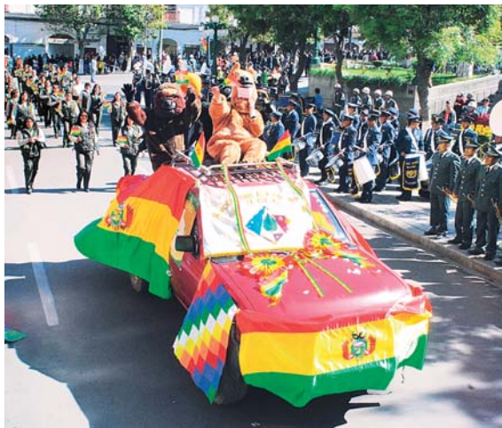
LOS HOMENAJES QUE RINDIERON LOS HABITANTES PACEÑOS A LA INDEPENDENCIA DE BOLIVIA, HOY LOS ACTOS CÍVICOS SE TRASLADAN A LA CIUDAD DE OROURO.

A juicio del ministro Luis Arce "la gente tiene más dinero y ha mejorado su capacidad de ahorro".