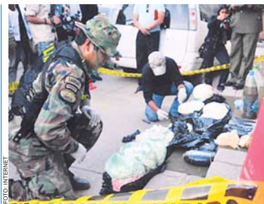
LA TAREA DE LOS GENDARMES EN LA ZONA NO ES FÁCIL, YA QUE POR EL PUENTE INTERNACIONAL ADUANERO PASAN A DIARIO UNAS 10.000 PERSONAS Y UNOS 300 CAMIONES.