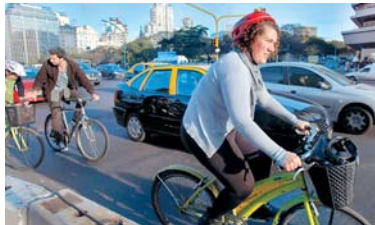
UNA JOVEN UTILIZA UNA BICICLETA DEL PROGRAMA "MEJOR EN BICI" EN BUENOS AIRES COMO ALTERNATIVA AL METRO, QUE COMPLETA SU SÉPTIMO DÍA DE HUELGA.