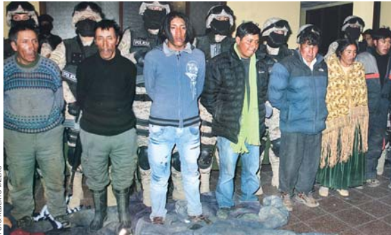
LOS NUEVE PRESUNTOS DELINCUENTES PRESENTADOS ANOCHÉ EN OFICINAS DE LA FELCC DEL ALTO. TAMBIÉN SE INCAUTÓ PARTE DEL BOTÍN DE VARIAS FECHORÍAS.