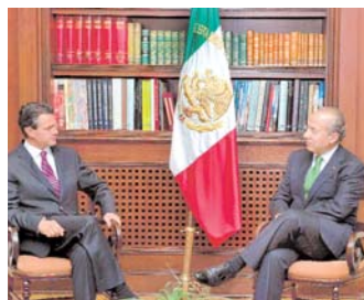
EL ELEGIDO ENRIQUE PEÑA NIETO EN SU VISITA AL ACTUAL TITULAR DE MÉXICO, FELIPE CALDERÓN.

El presidente de México, Felipe Calderón, dijo que deja un país con muchos avances, algunos históricos en materia de salud y educación, aunque reconoció que aún quedan muchas asignaturas pendientes, al hacer un balance de sus seis años de Gobierno.