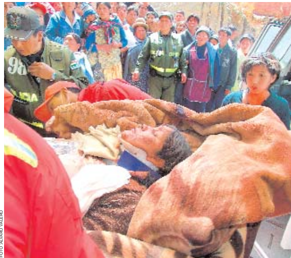
UNA DE LAS ACCIDENTADAS ES CONDUcida AL INTERIOR DEL HOSPITAL ARCO IRIS, MIENTRAS FAMILIARES DE LAS VÍCTIMAS BUSCAN A SUS SERRES QUERIDOS ENTRE EL LLANTO Y LA DESESPERACIÓN TRAS OTRA JORNADA TRÁGICA EN LA CARRETERA DE LA MUERTE.