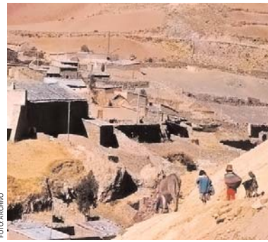
LA POBLACION DE COLQUECHACA VIVIO AYER UNA JORNADA VIOLENTA POR EL PROBLEMA DE LIMITES NO SOLUCIONADO