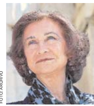
LA REINA SOFIA VISITARÁ NUEVAMENTE EL PAIS.

El martes 16 se entrevistará con el presidente Evo Morales, en Palacio de Gobierno donde se efectuará la Firma del Memorandum