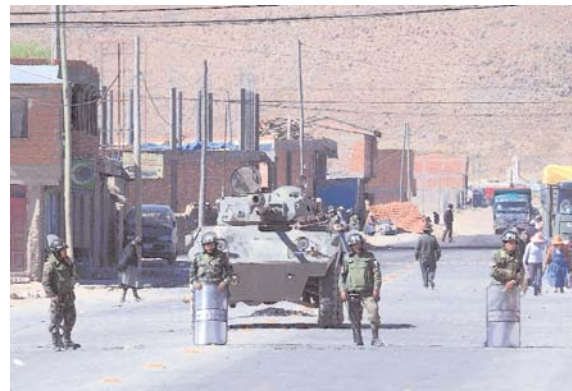
LOS MILITARES TOMAN EL CONTROL DE UNA DE LAS PRINCIPALES AVENIDAS DE CHALLAPATA. NO HUBO MÁS PROTESTAS NI ENFRENTAMIENTOS, PERO HAY UN AMBIENTE DE TENSION EN LA POBLACION. EL GOBIERNO ANUNCIA QUE PRESENCIA MILITAR PERMANECERA EN LA REGION.