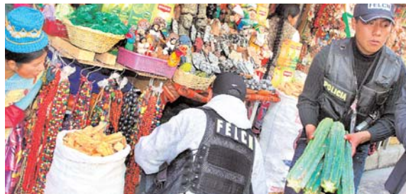
LA FELCN REALIZÓ AYER UN OPERATIVO PREVENTIVO EN LA CALLE LINARES DE LA PAZ, DECOMISANDO 184 PLANTAS DEL CACTUS SAN PEDRO, QUE RESULTARÍA SER UN ALUCINOGENO. LOS POLICIAS EXPLICARON A LAS VENDEDORAS QUE EL CACTUS CONTIENE EL ALCALOIDO MEZCALINA QUE ES RECONOCIDO COMO UNA SUSTANCIA CONTROLADA EN EL ANEXO 1 DE LA LEY 1008, POR LO TANTO LA COMERCIALIZACIÓN ESTÁ PENADA POR LEY.