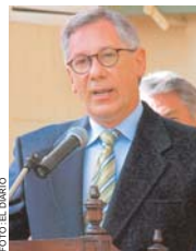
EDUARDO RODRÍGUEZ VELTZE