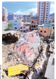
EL DESPLOME DEL EDIFICIO EN MIRAFLORES ES UN LLAMADO DE ATENCIÓN A TODOS.