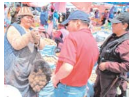
LOS BOLSILLOS DE LOS CIUDADANOS CADA VEZ QUEDAN VACIOS.