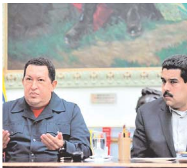
HUGO CHÁVEZ JUNTO A QUIEN SERÍA SU SUCESOR EN EL CARGO AL FRENTE DE VENEZUELA.

• El Mandatario venezolano apareció el sábado en cadena nacional desde el palacio de Miraflores, luego de una ausencia de más de 15 días, tras haber viajado a Cuba.