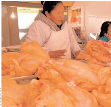
EL PRECIO DE LA CARNE DE POLLO IMPACTA EN EL BOLSILLO DE LOS CIUDADANOS