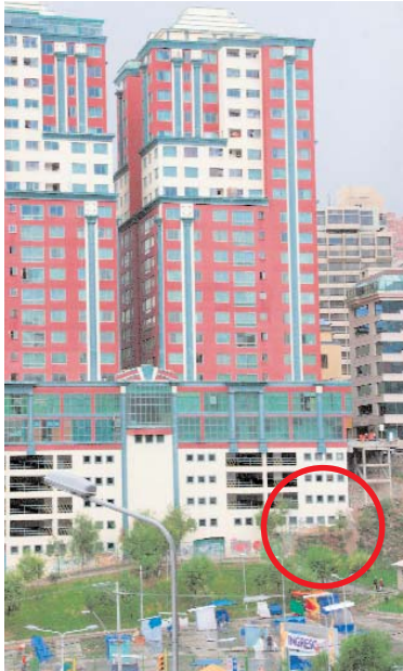
VISTA POSTERIOR DEL EDIFICIO EL ALCÁZAR, EN CÍRCULO LA PARTE AFECTADA.

• La juez Eneas Gentile cambió una decisión anterior, así permite que el estadounidense pueda dejar Palmasola donde estuvo recluso durante 18 meses clamando su inocencia.