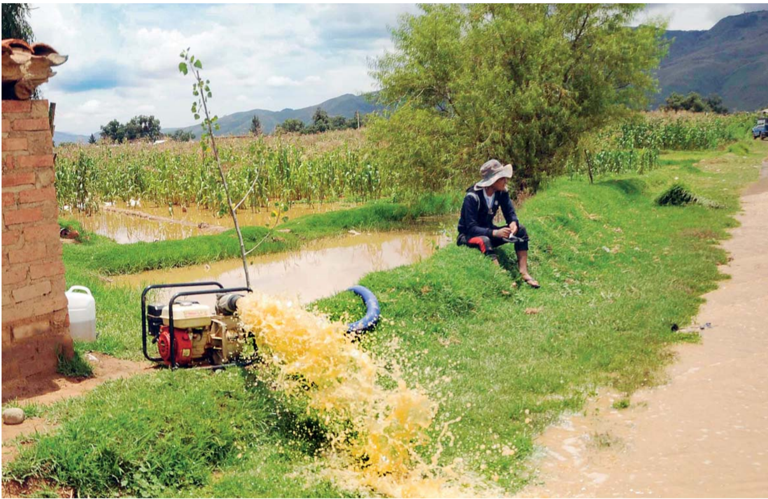
LOS PRODUCTOS AGRÍCOLAS QUEDARON DESTRUIDOS POR LA CRECIDA DE RÍOS, EL GRANIZO Y LA HELADA EN DIFERENTES REGIONES DEL PAÍS. LOS COMUNARIOS SE RESIGNAN ANTE LOS FENÓMENOS NATURALES.

Los productores y comunarios se vieron afectados por los desastres naturales que dañaron 17.486 hectáreas en el país. La severa temporada de lluvia registrada en los últimos días causó la pérdida de importante cantidad de productos agrícolas que quedaron bajo las aguas y no pudieron ser recuperados y otros sembradíos fueron destruidos por el granizo y las heladas.