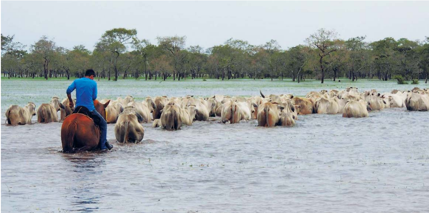
LA INUNDACIÓN DE ZONAS PRODUCTIVAS ARROJA RESULTADOS DESASTROSOS POR LA PÉRDIDA DE GANADO VACUNO QUE PODRÍA TENER CONSECUENCIAS POSTERIORES PARA EL ABASTECIMIENTO EN EL MERCADO NACIONAL.

• Beni perdió ganado menor y 40 por ciento de ganado mayor a punto de faenar; sin embargo, el representante de Fegasacruz asegura que no habrá desabastecimiento en el mercado interno y no afectará a las exportaciones.