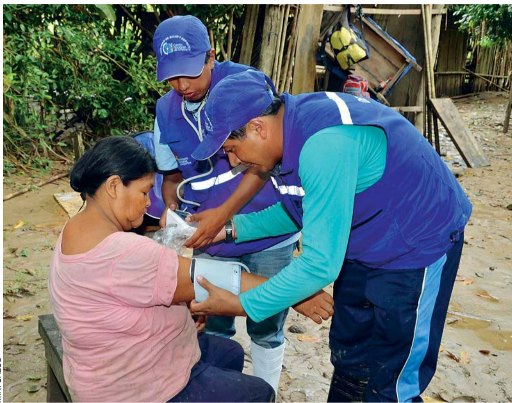
LA SALUD DE LA POBLACIÓN BENIANA ESTÁ EXPUESTA A ENFERMEDADES POR LOS DESECHOS QUE ARRASTRA EL CAUDAL DE AGUAS QUE DEJÓ INUNDADAS A VARIAS REGIONES DEL PAÍS.