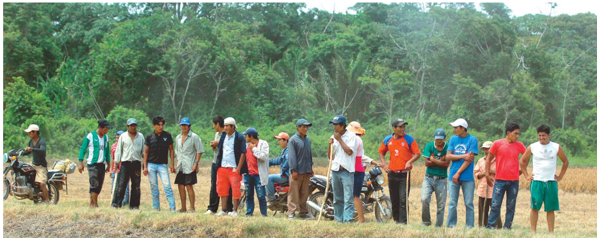
LOS GANADEROS DE SANTA CRUZ EXPRESAN SU DESEO DE RECUPERAR LAS TIERRAS TOMADAS DE MANERA ARBITRARIA POR GRUPOS DE PERSONAS. PIDEN A LAS AUTORIDADES SANCIONES CONTRA LOS AVASALLADORES.

Ganaderos cruceños quieren recuperar tierras