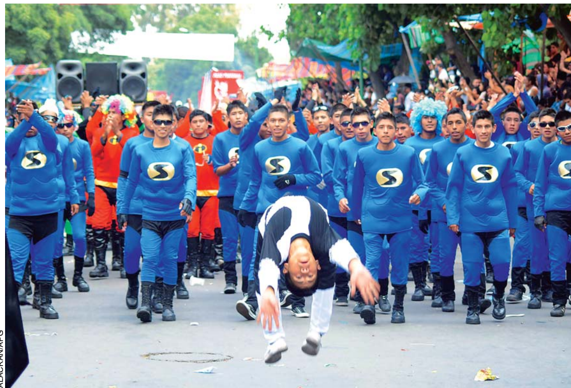
LA PARTICIPACIÓN DE EFECTIVOS MILITARES ALEGRÓ A LOS ESPECTADORES.