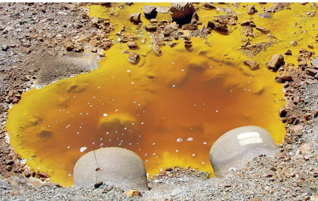
LOS NIVELES DE CONTAMINACIÓN MINERA AVANZAN DE MANERA PELIGROSA EN EL PAÍS. LOS TÓXICOS ENVENENAN LOS SUELOS Y LOS RÍOS, OCASIONANDO LA DEVASTACIÓN LENTA DEL HÁBITAT DEL SER HUMANO, SU FLORA Y SU FAUNA.

Bolivia vive una crisis climática que tiene un impacto negativo en el medioambiente como consecuencia de una variedad de actividades, entre ellas se identifica a la contaminación minera, como una de las más latentes.