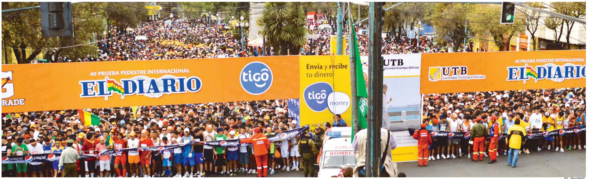
PRUEBA PEDESTRE DE EL DIARIO ES SINÓNIMO DE BOLIVIANIDAD. ES LA MUESTRA MÁS FEACIENTE DEL COMPROMISO ENTRE NUESTRO MATUTINO Y LA POBLACIÓN QUE NOS HONRA CON SU APOYO INCONDICIONAL.

• Bolivia espera de pie la XLI Prueba Pedestre Internacional de EL DIARIO, en conmemoración a los 110 años de vida del "Decano de la Prensa Nacional".