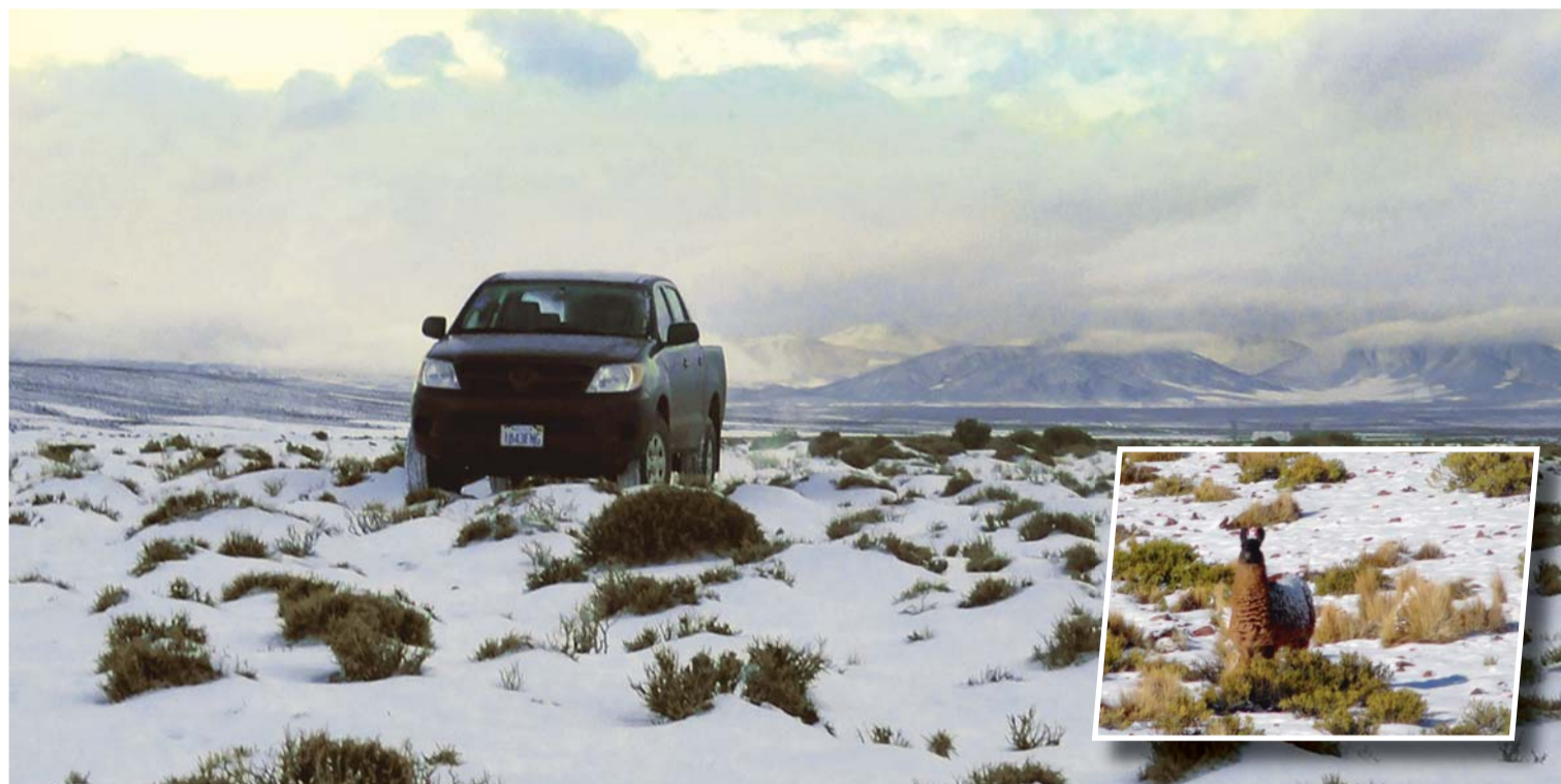
EL FRÍO INTENSO POR LA NEVADA Y FUERTES VIENTOS AFECTAN PELIGROSAMENTE A LA PRODUCCIÓN AGROPECUARIA DE VARIAS COMUNIDADES DE ORURO Y POTOSÍ, LAS QUE BUSCAN LA DECLARATORIA DE REGIONES DE DESASTRE.