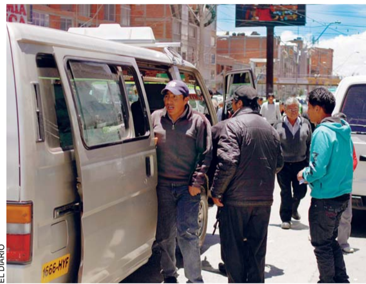
TRANSPORTISTAS PRESIONAN POR VIGENCIA DEL PASAJE ÚNICO EN EL ALTO.