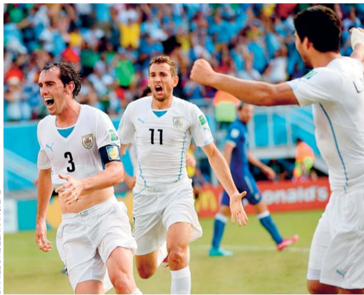
DANIEL DAL ZENNARO/OFEE