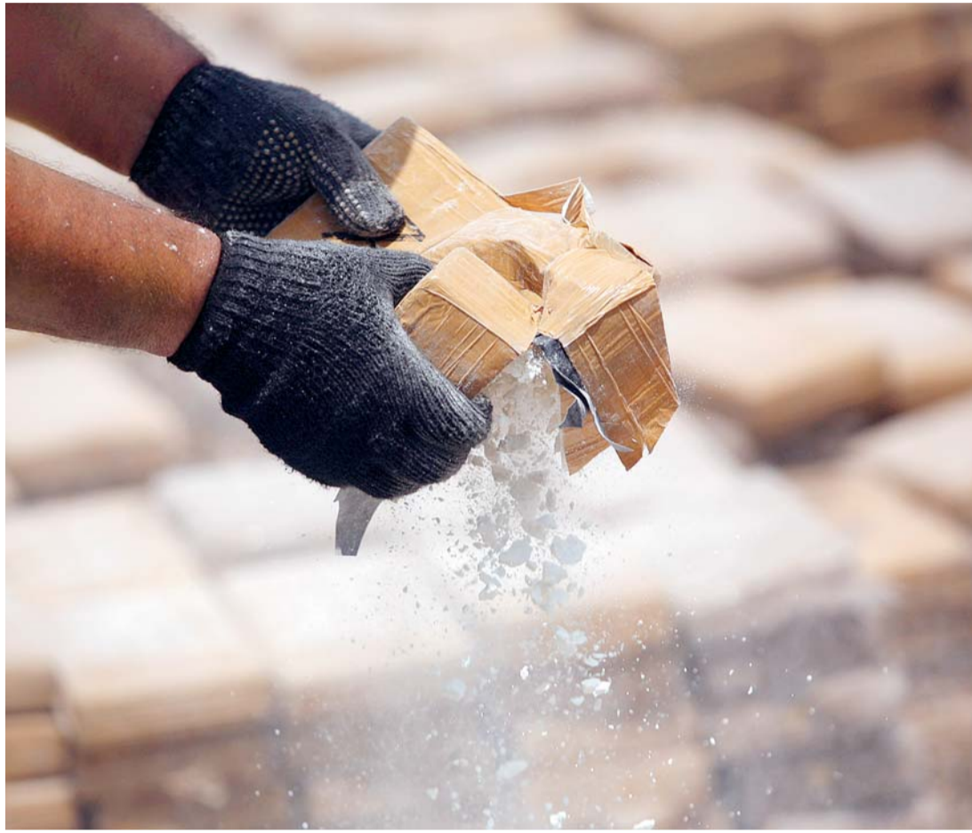
AUTORIDADES BOLIVIANAS RECONOCIERON QUE UN 47% DE LA PRODUCCIÓN DE LA COCA ES DESVIADA A LA ACTIVIDAD ILÍCITA DEL NARCOTRÁFICO.