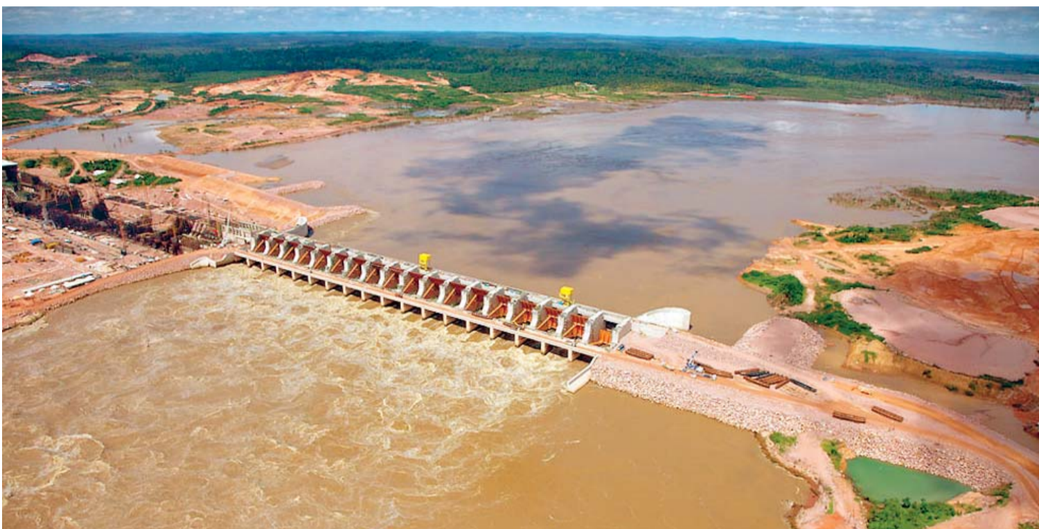
LA MAGNITUD DE LAS INUNDACIONES EXTREMAS REGISTRADAS EN LA REGIÓN AMAZÓNICA DEL PAÍS CONTINÚAN GENERANDO POLÉMICA Y UN GRUPO DE EXPERTOS REALIZAN ESTUDIOS SOBRE LOS IMPACTOS DE LAS REPRESAS BRASILEÑAS DE SAN ANTONIO Y JIRAU.

• Un grupo de instituciones privadas realizan una investigación independiente para certificar cuáles fueron los hechos que ocasionaron desbordamientos en la región norte del territorio boliviano.