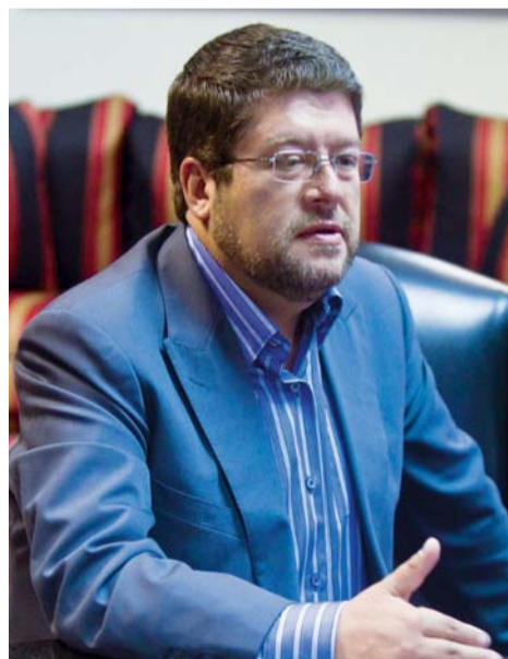
SAMUEL DORIA MEDINA, LÍDER DE UNIDAD NACIONAL.