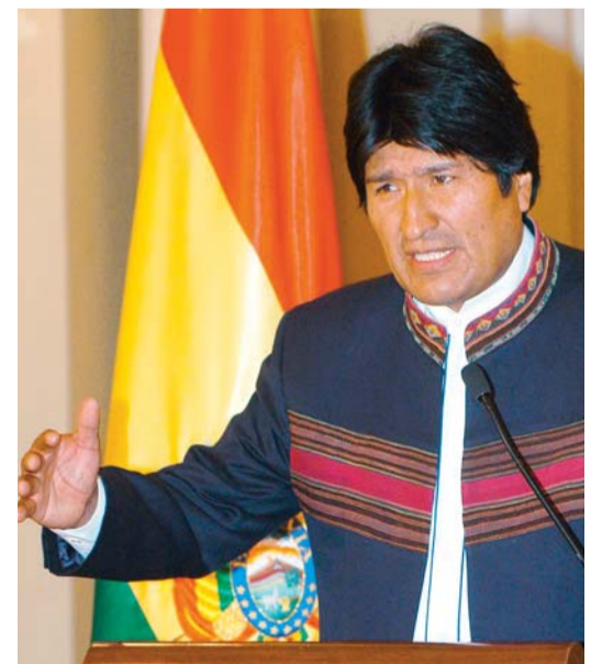
EVO MORALES, PRIMER MANDATARIO DE BOLIVIA.

El Gobierno comete una arbitraria expropiación.