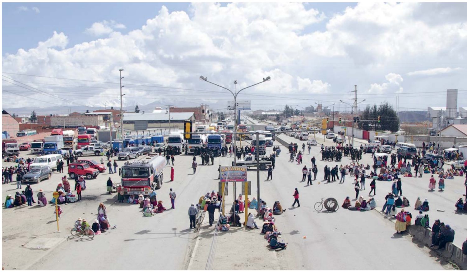
LA ZONA SENKATA DE LA CIUDAD DE EL ALTO QUEDÓ PARALIZADA POR LA PROTESTA DE LOS PADRES DE FAMILIA, QUIENES EXIGIERON MEJORAS EN LA INFRAESTRUCTURA Y MOBILIARIO DE UNIDADES EDUCATIVAS DEL DISTRITO 8.