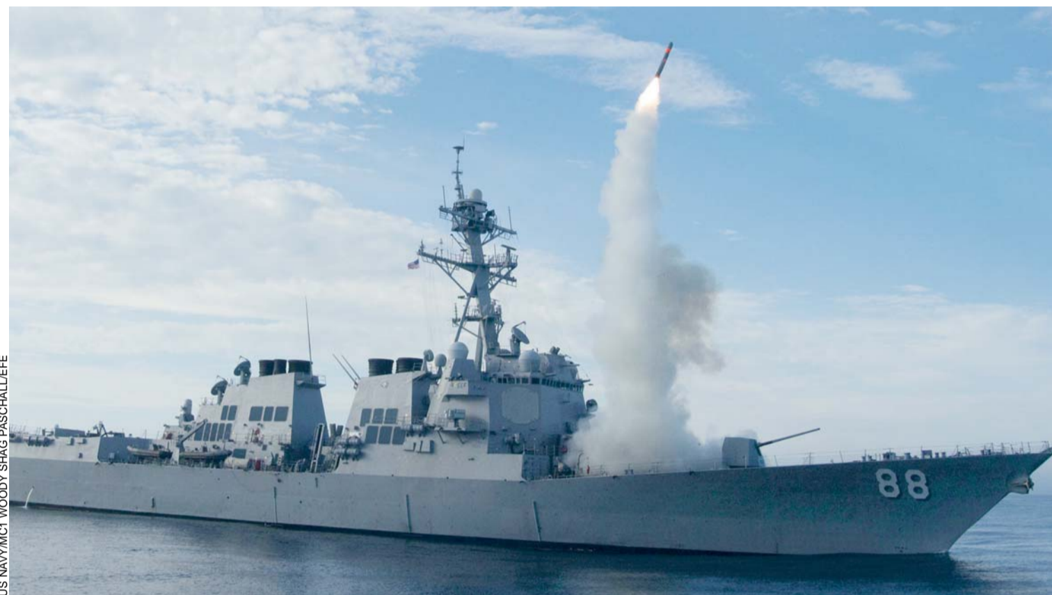
ESTADOS UNIDOS Y "NACIONES ALIADAS" INICIARON EL LUNES LA OFENSIVA DE ATAQUES AÉREOS CONTRA EL GRUPO YIHADISTA ESTADO ISLÁMICO (EI) EN SIRIA. LA FOTOGRAFÍA MUESTRA AL BUQUE USS PREBLE LANZANDO UN MISIL TOMAHAWK.

Según el comunicado de la entidad castrense, la embarca-