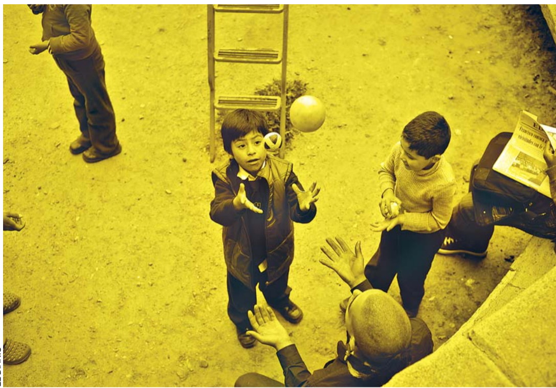
LOS BOLIVIANOS NACEN CONDICIONADOS A UNA DEUDA QUE PUEDE FRENAR SUS ESPERANZAS Y SUEÑOS, ES POR ELLO QUE MUCHOS SE VEN OBLIGADOS A REALIZAR MALABARISMOS PARA ENFRENTAR SU INCIERTO FUTURO.

Según el viceministro Rojas, las deudas que asumió el Estado en los últimos ocho años permitieron desarrollar la economía del país porque fueron recursos invertidos en carreteras, escuelas y hospitales, en producción y redistribución de ingresos entre la población.