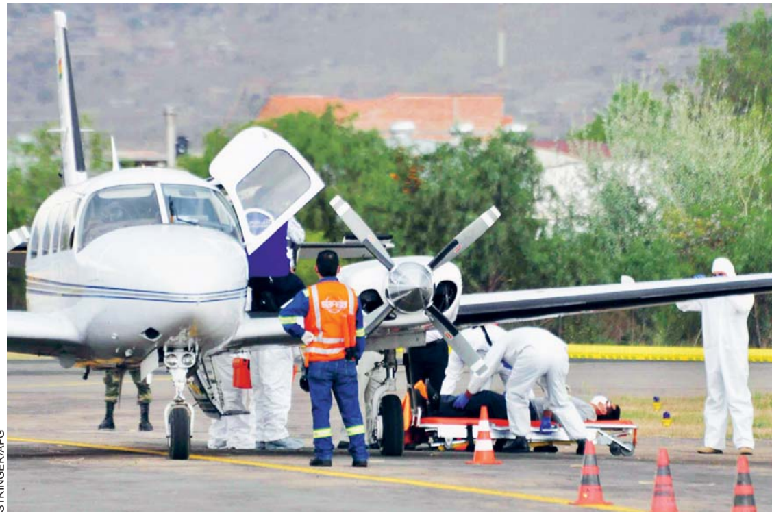
UN SIMULACRO PARA PREVENIR CUALQUIER TIPO DE AMENAZA DE ÉBOLA EN BOLIVIA, SE REALIZÓ AYER EN EL AEROPUERTO JORGE WILSTERMANN DE COCHABAMBA.