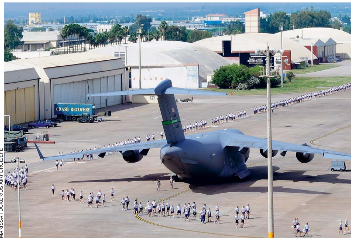
LA BASE AÉREA DE INCIRLIK, SITUADA EN EL SUR DE TURQUÍA, SERÍA UN PUNTO DE SALIDA IDEAL PARA LA FUERZA AÉREA ESTADOUNIDENSE QUE BOMBARDEA LAS POSICIONES DE LOS YIHADISTAS.