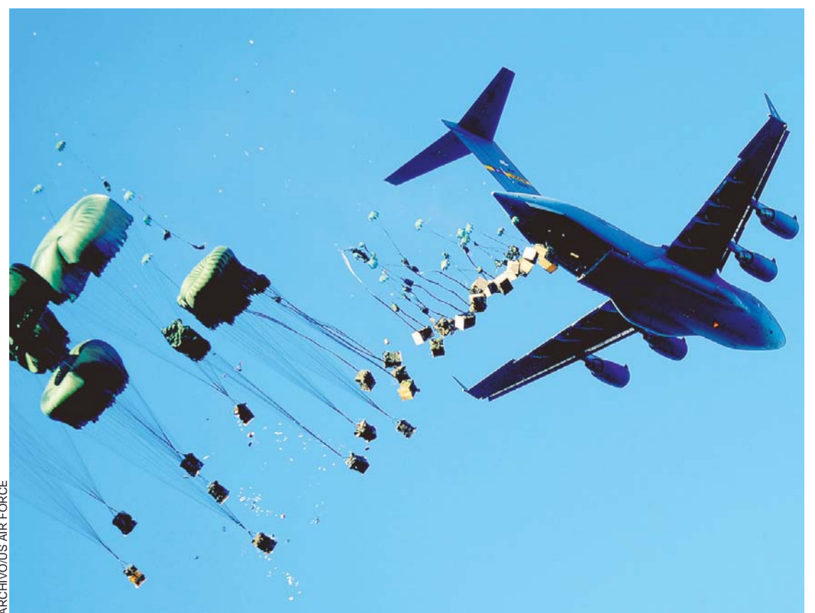
AVIONES ESTADOUNIDENSES ABASTECEN DE ARMAS, MUNICIONES Y MEDICAMENTOS A LOS COMBATIENTES KURDOS QUE LUCHAN CONTRA EL GRUPO TAKFIRI EIL (DAESH, EN ÁRABE) EN LA CIUDAD SIRIA DE KOBANI.