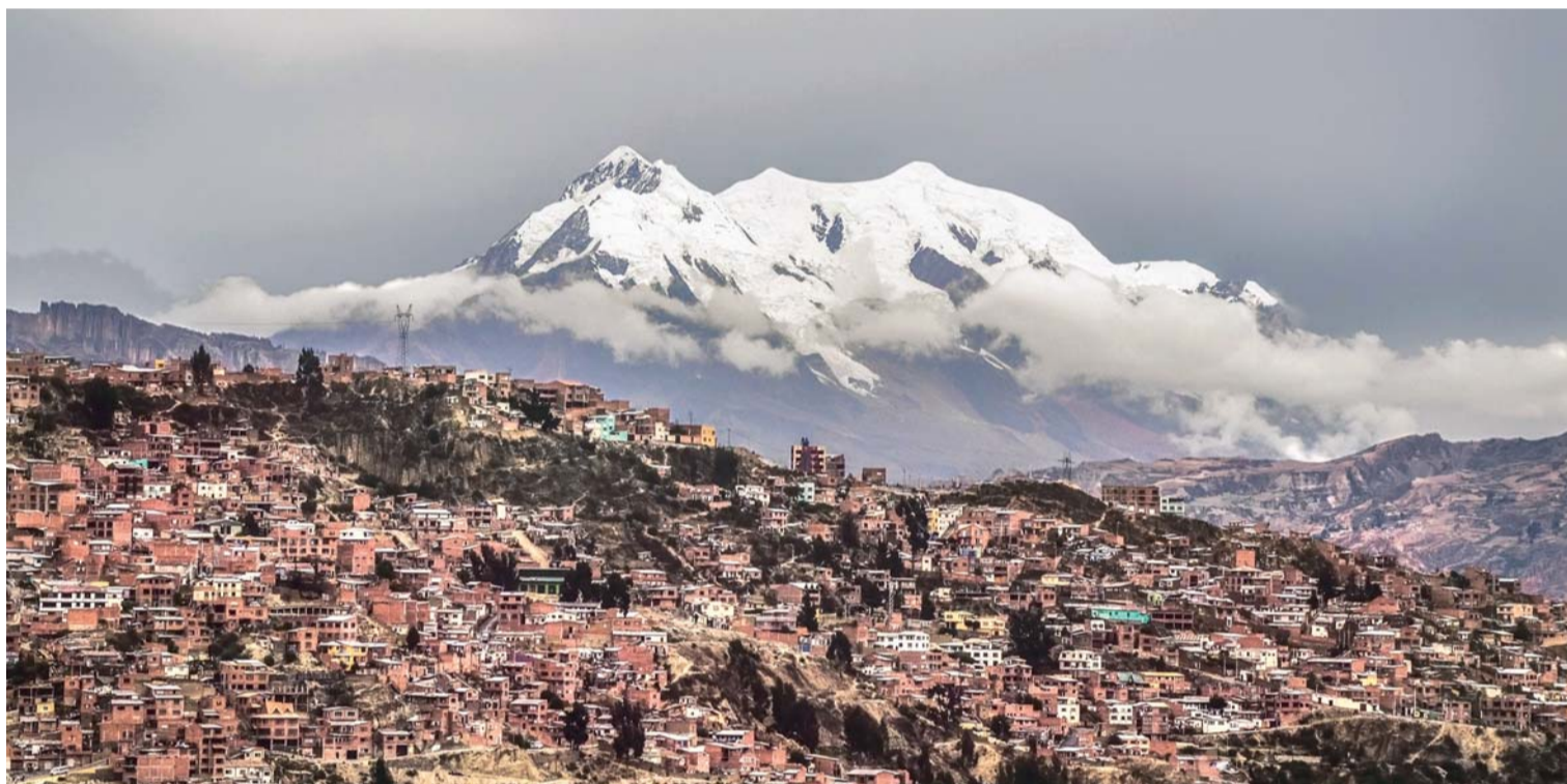
466 años de la fundación de La Paz

Asimismo, para el tratamiento de la enfermedad del mal de chagas en Bolivia se entregarán, 30 mil comprimidos de Benznidazol de 12,5 miligramos. Además a corto plazo se prevé la donación de 10.000 unidades de Estreptomina de 1 gramo, también para el Programa Nacional de Control de Tuberculosis. (ANF)