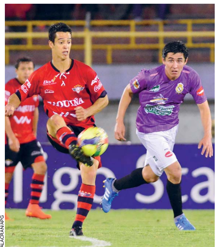
Wilstermann por el primer puesto

CON UN GOL QUE LLEGÓ SOBRE LA HORA, EL PLANTEL DE WILSTERMANN LOGRÓ DERROTAR ANOCHE A REAL POTOSÍ POR 1-0 EN EL ESTADIO FÉLIX CAPRILES Y CONTINÚA EN LA PUGNA POR ALCANZAR EL PRIMER PUESTO DE LA TABLA DE POSICIONES DEL CAMPEONATO APERTURA, MIENTRAS QUE EN ORURO, SAN JOSÉ GANÓ 2-1 A UNIVERSITARIO DE PANDO.