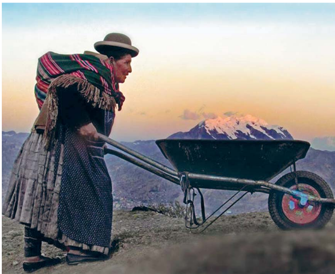
Fotografía más vista en el mundo

LA FOTOGRAFÍA QUE MUESTRA A UNA SEÑORA CARGANDO UN AGUAYO Y LLEVÁNDOSE EN UNA CARRETILLA AL MAJESTUOSO ILLIMANI, EL ICONO DE LA CIUDAD DE LA PAZ, SE VOLVIÓ VIRAL EN LAS REDES SOCIALES Y EL INTERNET. LA IMAGEN COMPARTIDA MÁS DE UN MILLÓN DE VECES QUE LLEGÓ A FRANCIA, ESTADOS UNIDOS, ESPAÑA Y OTROS PAÍSES, FUE APROVECHADA POR MEDIOS DE COMUNICACIÓN E INCLUSO EN EL PORTAL DIGITAL DE LA ORGANIZACIÓN "NEW 7 WONDERS", QUE PATROCINA EL CONCURSO DE LAS SIETE CIUDADES MARAVILLA DEL MUNDO, EN EL QUE PARTICIPA LA CIUDAD DE LA PAZ.