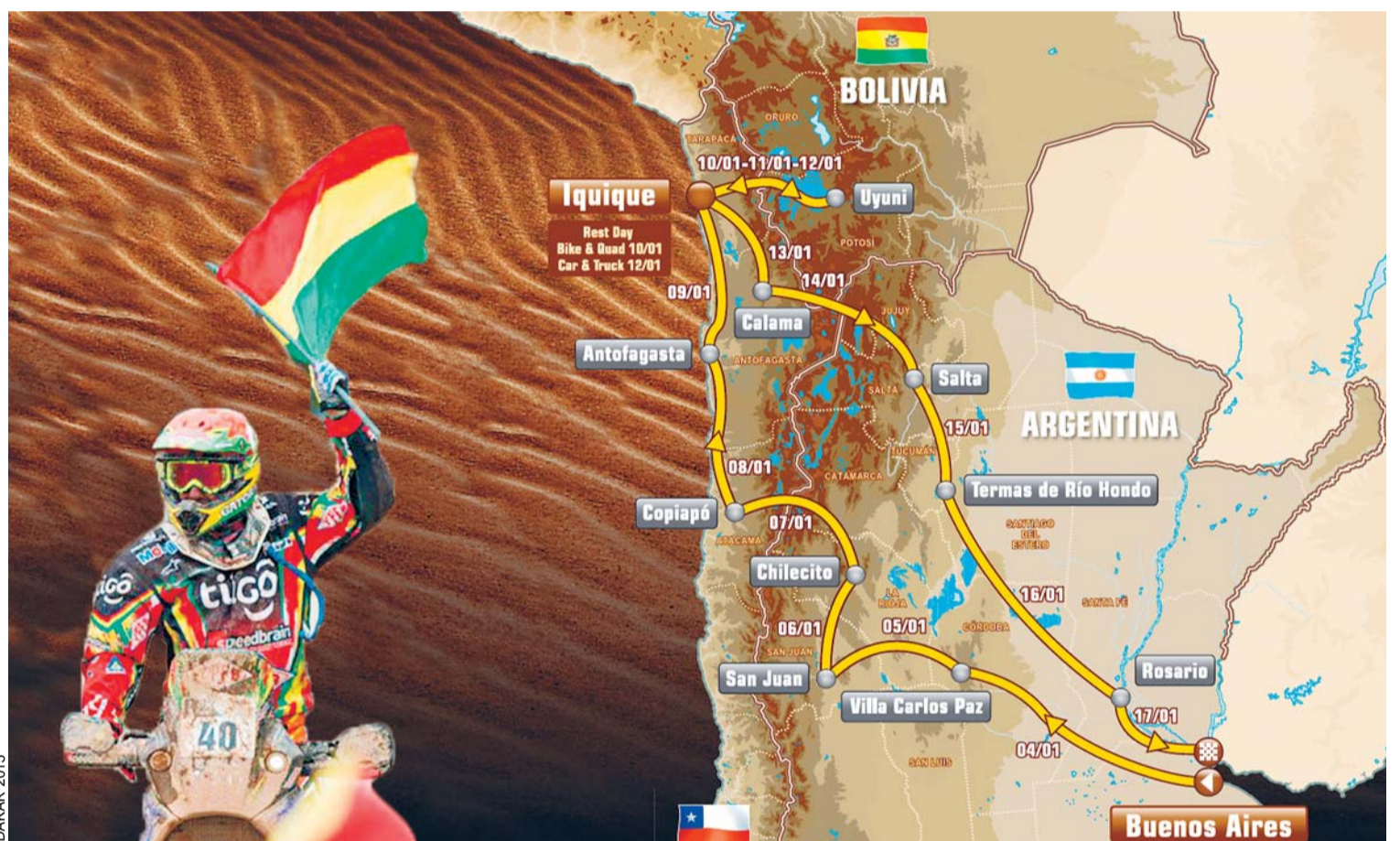
Argentina, Chile y Bolivia anfitriones del Dakar

EL RECORRIDO DEL RALLY DAKAR 2015 FUE PRESENTADO AYER EN PARÍS, QUE POR SEXTO AÑO SE DISPUTARÁ EN TIERRAS AMERICANAS. BUENOS AIRES, COMO YA OCURRIÓ EN LAS EDICIONES DE 2009, 2010 Y 2011, SERÁ LA CIUDAD DE INICIO Y FINAL DE ESTA GRAN CARRERA, CONSIDERADA UNA DE LAS MÁS DIFÍCILES. LOS PILOTOS TENDRÁN QUE RECORRER 9.000 KILÓMETROS A