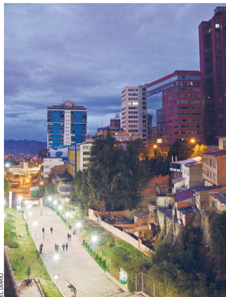
CIUDAD DE CONTRASTES, LA PAZ A LA ESPERA DE SU NOMINACIÓN.