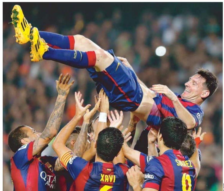
EL SÚPER ASTRO DEL FÚTBOL MUNDIAL, LIONEL MESSI, RECIBE LA OVACIÓN DE LA HINCHADA Y LA EUFORIA DE SUS COMPAÑEROS DE PLANTEL.