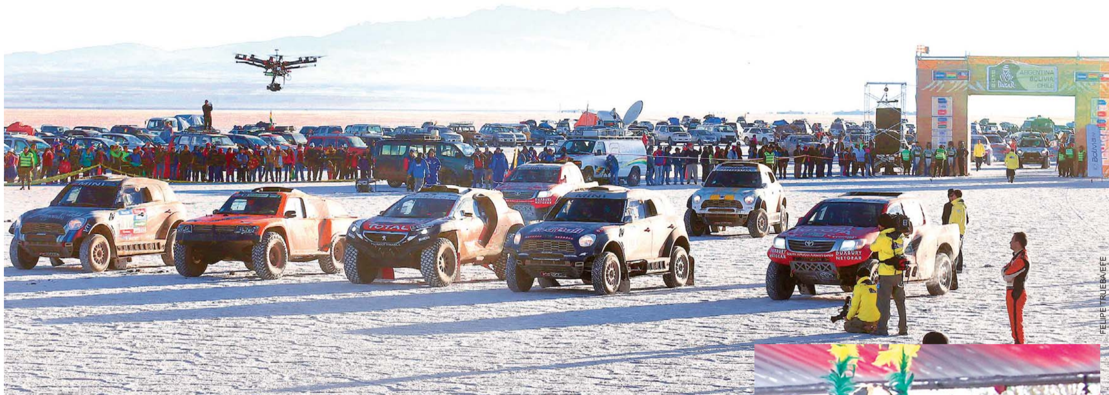
UN MANTO BLANCO Y DECENAS DE COCHES DISPUTANDO EN EL RALLY DAKAR GENERARON UN GRAN ESPECTÁCULO. CIENTOS DE PERSONAS DISFRUTARON CON EL PASO DE MOTORIZADOS POR EL MAJESTUOSO SALAR DE UYUNI.

• La largada de los coches para completar la octava etapa del Rally Dakar 2015 se cumplió temprano en el majestuoso salar de Uyuni, a dos kilómetros de Colchani. Los pilotos bolivianos fueron recibidos como héroes en la ciudad de Uyuni y los internacionales con aplausos.