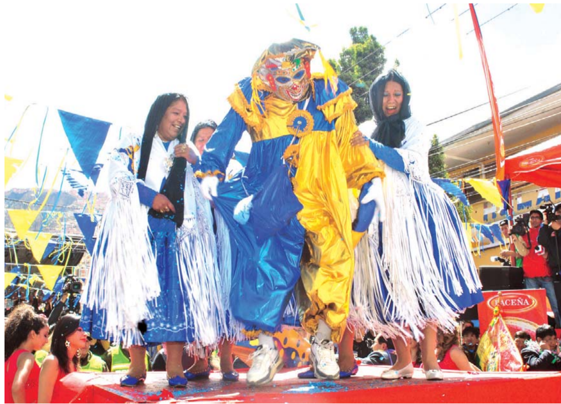
CON EL DESENTIERRO DEL PEPINO SE DIO INICIO A LAS ACTIVIDADES DE LA FIESTA DEL CARNAVAL PACEÑO QUE SE DESARROLLARÁ DESDE EL SÁBADO 15 HASTA EL MARTES 17 DE FEBRERO.