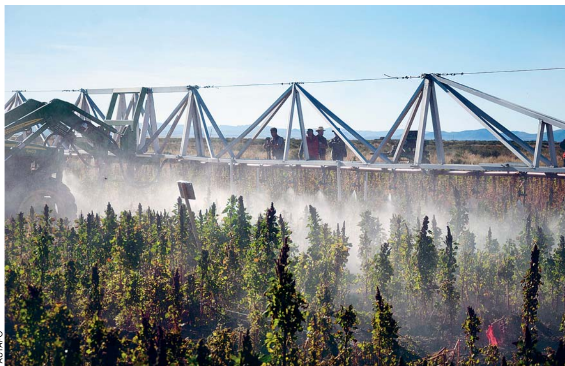
LA CÁMARA DE PRODUCTORES DE QUINUA SOSTIENE QUE EN BOLIVIA ESTE SECTOR NO CUENTA CON APOYO NI CON POLÍTICAS PÚBLICAS CLARAS.

Posesionados ambos contendientes a 96 leguas al norte de Lima se aprestaban a librar la batalla decisiva que sellaría la suerte y el futuro de Bolivia, Perú y Chile.