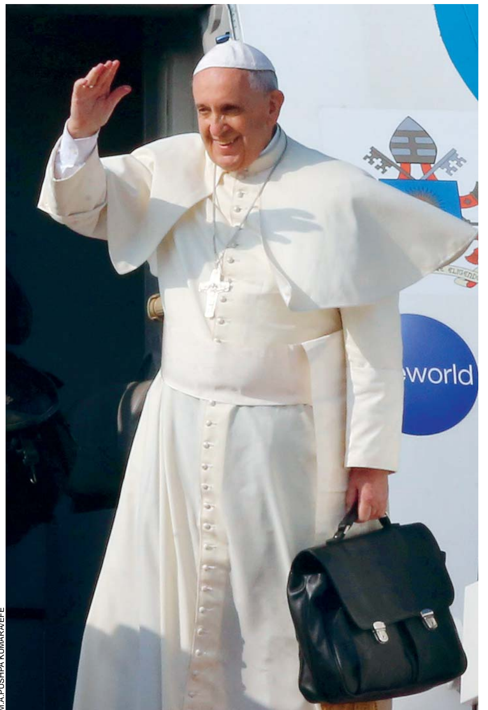
PAPA FRANCISCO SE DISPONE A VISITAR TRES PAÍSES DE LATINOAMÉRICA.