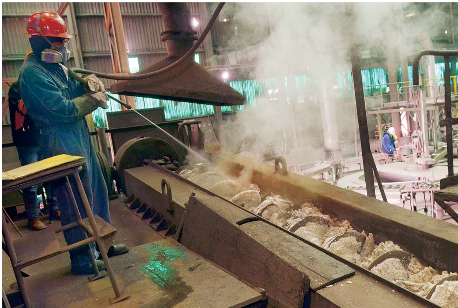
EL PRESIDENTE EVO MORALES Y AUTORIDADES NACIONALES INAUGURARON EL GIGANTESCO HORNO AUSMELT DE LA EMPRESA METALÚRGICA VINTO CON LA FINALIDAD DE ELEVAR LA PRODUCCIÓN DEL ESTAÑO METÁLICO.