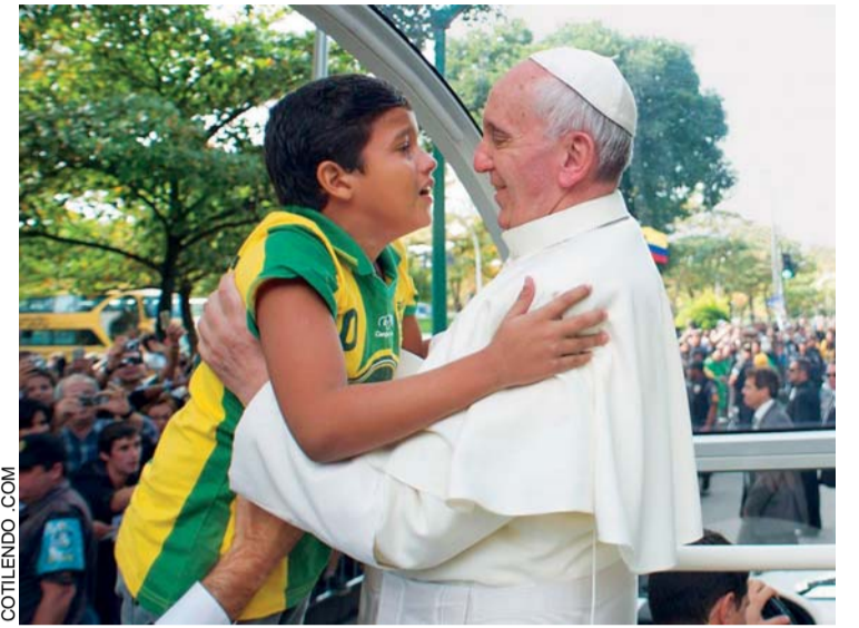
LA FOTO MÁS EMBLEMÁTICA ES LA DEL NIÑO QUE SE ACERCÓ AL PAPA FRANCISCO EN BRASIL.