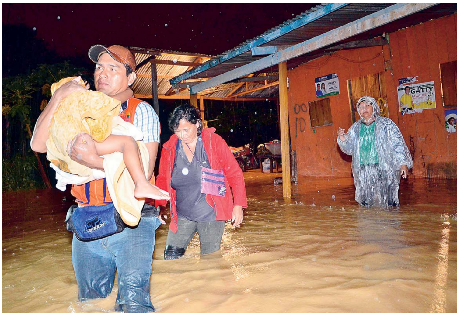
LA ESTACIÓN DE ECOLOGÍA DEL PUNTO TRIPARTITO DE BOLPEBRA REGISTRÓ AYER UN PELIGROSO CRECIMIENTO DEL CAUDAL DE AGUA. LA POBLACIÓN PANDINA CONTINÚA EN EMERGENCIA.

"Vamos a actuar apegados a la normativa interna y además internacional, hasta la apelación estariamos agotando instancia dentro de nuestro territorio nacional", anunció. (ANF)