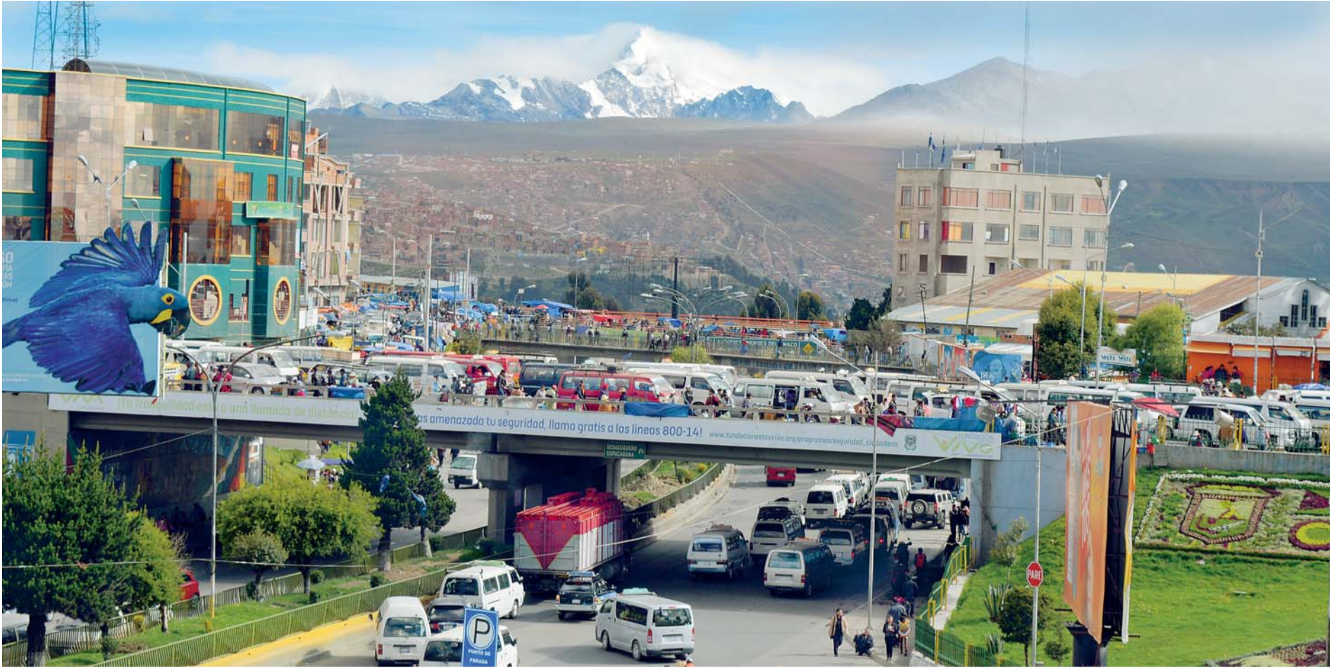
EL ALTO LLEGA A TRES DÉCADAS DE SU EXISTENCIA COMO CIUDAD CRECIENTE, CUYA POBLACIÓN ES RECONOCIDA COMO GUARDIÁN DE LOS RECURSOS NATURALES DEL PAÍS.