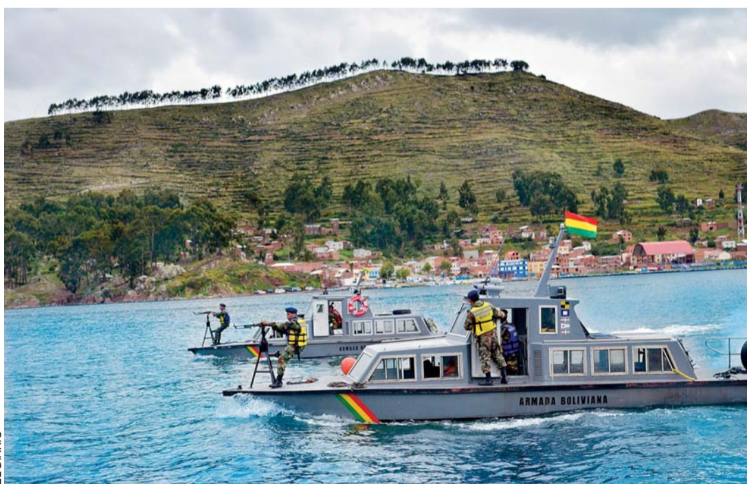
BOLIVIA Y PERÚ APLICARÁN ACCIONES BINACIONALES PARA EL CONTROL FLUVIAL, TERRESTRE Y AÉREO PARA COMBATIR LA ACTIVIDAD DEL NARCOTRÁFICO.