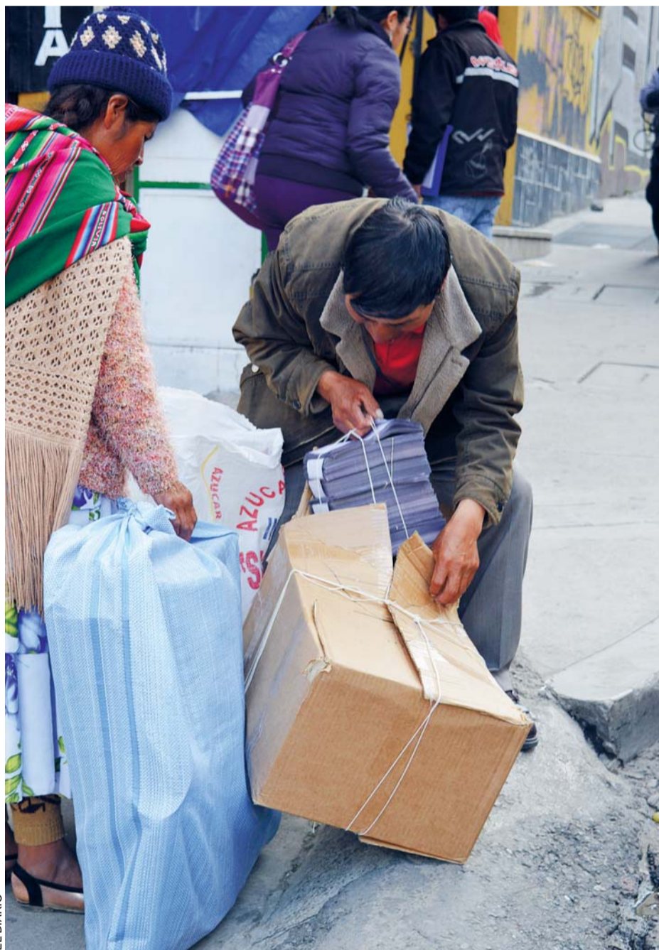
EL MATERIAL ELECTORAL PARA EL ÁREA RURAL FUE ENTREGADO Y SON TRASLADADOS SIN RESGUARDO ALGUNO, SITUACIÓN QUE CREA SUSCEPTIBILIDAD ENTRE LA CIUDADANÍA.