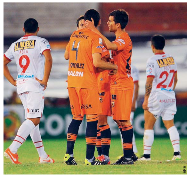
Huracán no pudo ante la "U"

HURACÁN SE ESTRELLÓ CONTRA UNA MURALLA DEFENSIVA DE UNIVERSITARIO DE SUCRE EN EL ESTADIO TOMÁS ADOLFO DUCÓ Y LE RESULTÓ DIFÍCIL SUPERAR ESTE OBSTÁCULO, QUEDANDO CON UN AMARGO EMPATE (1-1) QUE DEJA BASTANTE COMPROMETIDA SU CLASIFICACIÓN A OCTAVOS DE FINAL DE LA LIBERTADORES DE AMÉRICA, DESPUÉS DEL ENCUENTRO DISPUTADO ANOCHE.