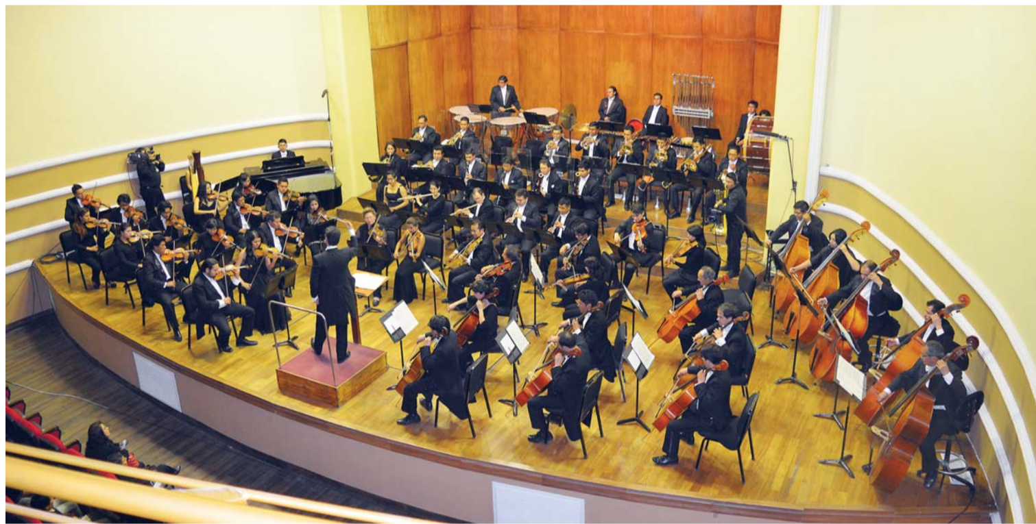
Bolivia y Rusia, unidas por medio de la música

MÁS DE MIL PERSONAS SE TRANSPORTARON ANOCHE A UNA "FANTASÍA RUSA" GRACIAS A LA ORQUESTA SINFÓNICA BOLIVIANA QUE SE PRESENTÓ EN UN CONCIERTO EN EL CENTRO SINFÓNICO.