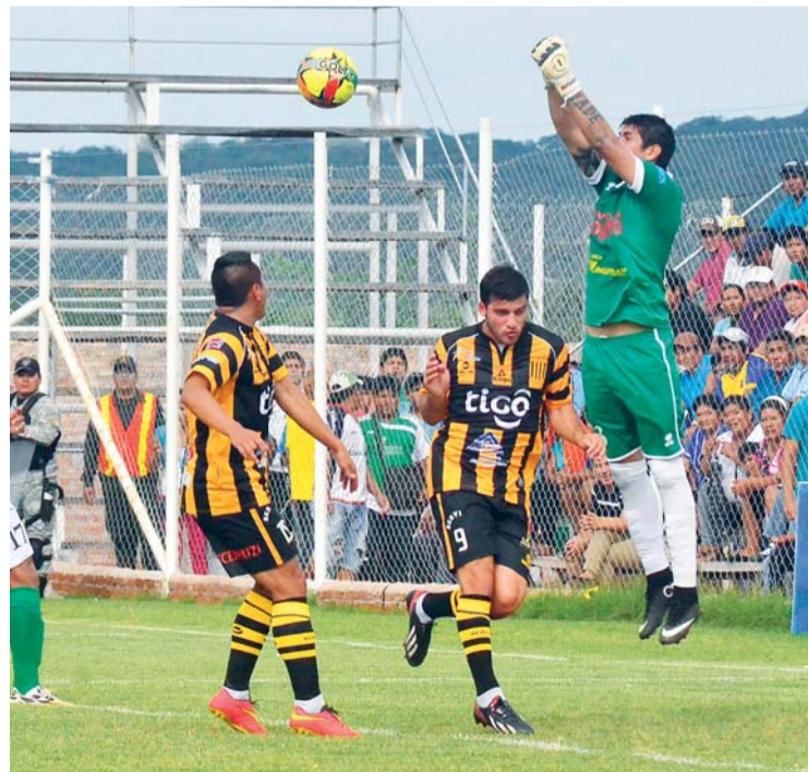
El Tigre cayó en Yacuiba

PETROLERO SE QUITÓ DE ENCIMA LA MALA RACHA CON UN TRIUNFO SOBRE THE STRONGEST POR 3-2, LOS GOLES DE VICTORIA LLEGARON EN LOS MINUTOS FINALES DEL ENCUENTRO EN EL ESTADIO FEDERICO IBARRA.