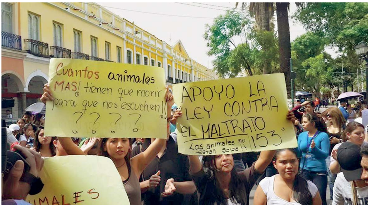
ACTIVISTAS ENCABEZARON UNA MARCHA QUE RECORRIÓ EL CENTRO DE LA CIUDAD CON PANCARTAS, RECHAZANDO EL MALTRATO ANIMAL. PIDEN SANCIONES EJEMPLARIZADORAS PARA EVITAR ESTOS HECHOS LÚGUBRES.