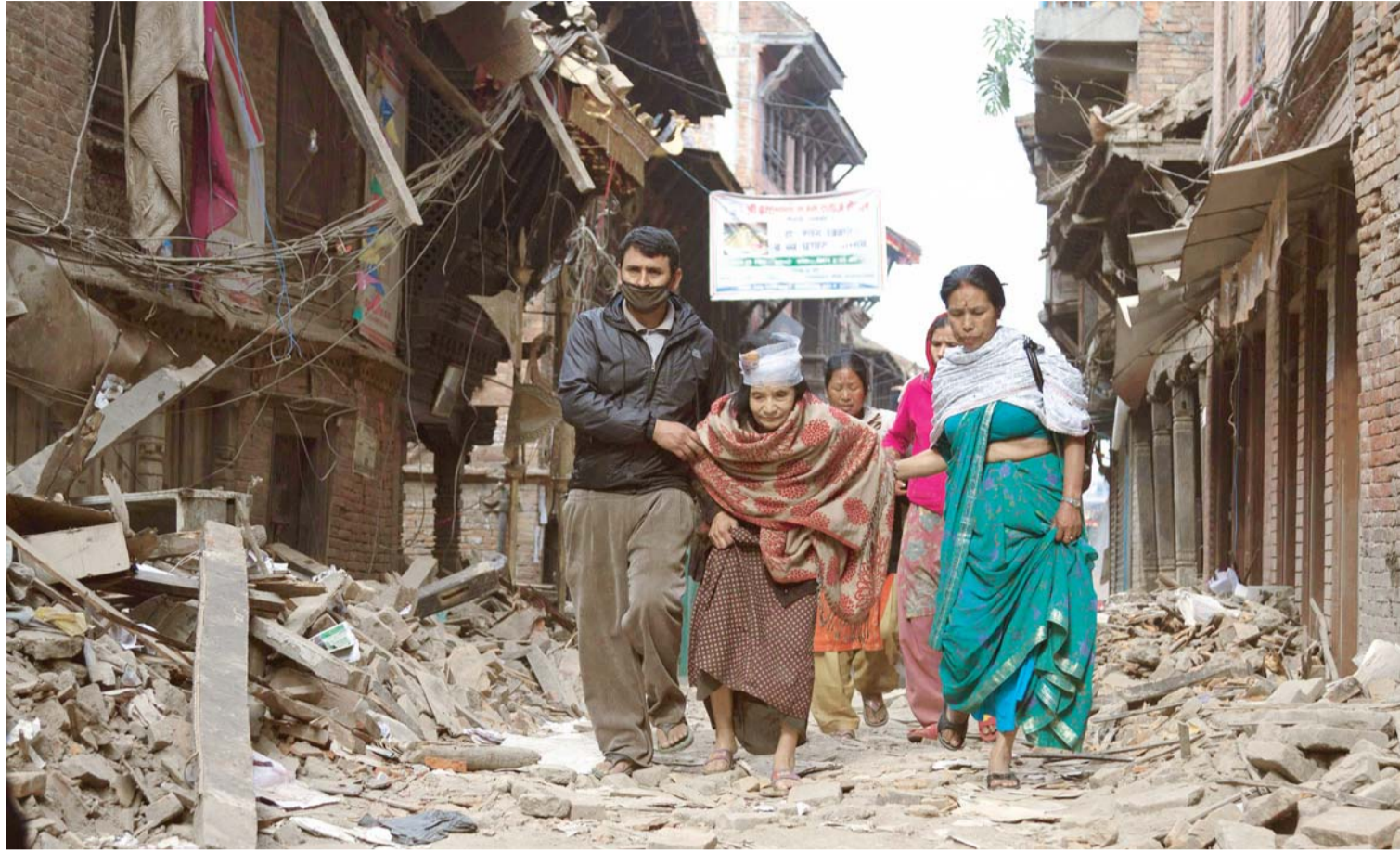
Cifra de muertos sube a más de 3.200 tras terremoto en Nepal

CIENTOS DE RESIDENTES BUSCAN ALOJAMIENTO SEGURO, DESPUÉS DEL DEVASTADOR TERREMOTO EN NEPAL, QUE HASTA AHORA HA DEJADO 3.218 MUERTOS Y MÁS DE 6.535 HERIDOS, SEGÚN LAS RECIENTES CIFRAS OFICIALES, MIENTRAS UN NUEVO TEMBLOR DE 6,7 GRADOS ATERROZÓ AYER A LOS NEPALÍES Y DIFICULTÓ LAS LABORES DE RESCATE. EL DEVASTADOR SISMO AFECTÓ, ADEMÁS, A LAS NACIONES CERCANAS Y CAUSÓ LA MUERTE DE 62 PERSONAS EN EL NORTE DE INDIA, 20 EN CHINA Y UNA EN BANGLADESH. PAÍSES Y ORGANISMOS INTERNACIONALES EMPEZARON A ENVIAR AYUDA MÉDICA Y PERSONAL ESPECIALIZADO ANTE EL COLAPSO DE LOS HOSPITALES PARA ATENDER A HERIDOS, VOLUNTARIOS AÚN BUSCAN SOBREVIVIENTES ENTRE LOS ESCOMBROS A PESAR DE LA LLUVIA.