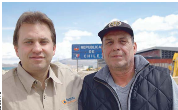
IMAGEN QUE CIRCULÓ POR AGENCIAS NOTICIOSAS Y REDES SOCIALES QUE DA CUENTA DE LA SALIDA DE TÓÁSÓ Y TADIC.