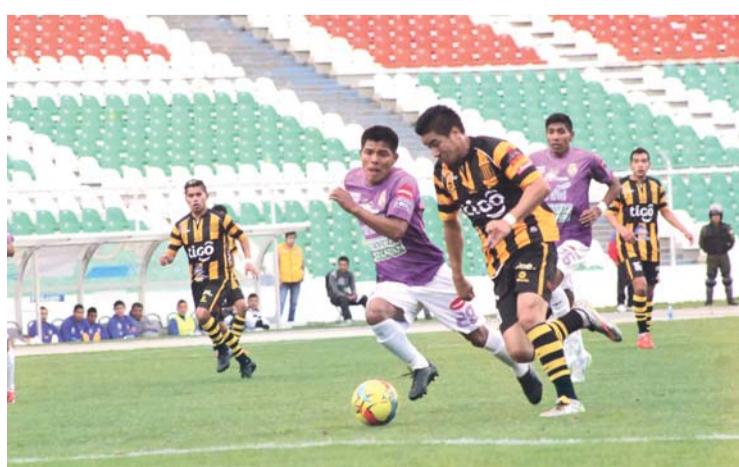
INCIDENCIA DEL PARTIDO EN QUE AURINEGROS SUPERARON A POTOSINOS AYER EN EL ESTADIO HERNANDO SILES DE LA PAZ.

Con la derrota del puntero Bolívar por 3 a 2 frente a Sort Boys en Warnes y luego de haberse impuesto como local a Real Potosí por 3-0 en cumplimiento de la jornada 18 del torneo Clausura de Liga del Fútbol Profesional Boliviano, The Strongest aún abraza esperanzas de llegar a coronarse campeón.